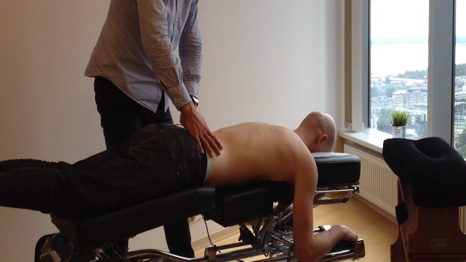
Näide: L1 kiropaktiline korrigeerimine